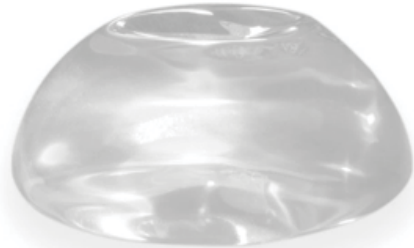
Implant mammaire NATRELLE TruForm MD 1